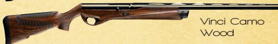
Vinci Camo Wood