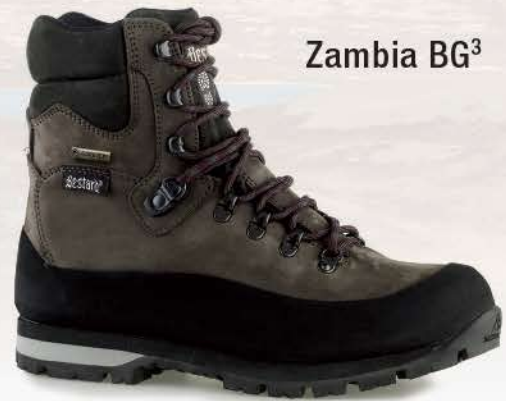
Zambia BG 3